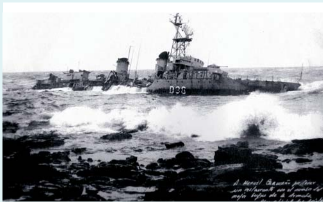
A Mariñeira que se encontra no restaurante con el parvato do Ariete despois de a Armada.